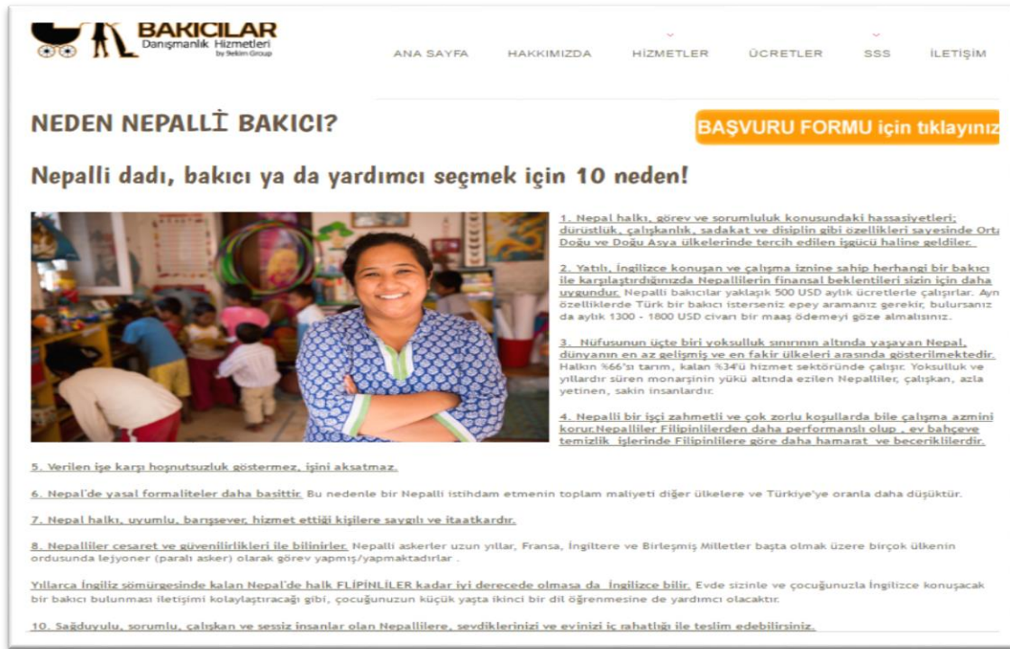
Figür 5. Bakıcı kadın stereotiplerinin inşa edildiği bir internet ilanı (www.yabancibakicilar.com' dan 20.11.2017)

ediyorlar. Kısacası hizmet talep edenlerin zihinlerinde ırklara göre kalıp yargılarla bezeli şematik imgeler oluşturulmaya çalışılıyor. Ailelerin bakıcı kadınlardan neleri isteyip neleri isteyemeyecekleri de dolaşıma sokulan ilanlar doğrultusunda açıklığa kavuşturulmuş oluyor aslında. Ancak sürecin başkarakteri olan bakıcı kadınlar ideal bir özne olarak bu söylem inşasının hangi veçhesini teşkil ediyor? Bu sorunun cevabı seçilmiş ilanları arkasındaki ideolojik söylemlerde gizlidir.