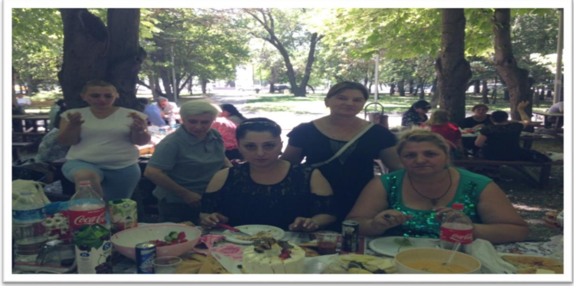
Resim 1. (5 Temmuz 2017 Kurtuluş Pakı, Gürcü Kadınların hafta sonu pratiği)

Gürcü Bakıcı Kadınların hafta sonları izin günlerini geçirmeyi tercih ettikleri Kurtuluş Parkından bir kare. Kurtuluş Parkındaki bu 15 20 masalıklı alan çoğunluğunun eski Doğu Bloğu ülkelerinden gelen kadınların oluşturduğu adeta görünmez bir duvarla örülü gibiydi. Etrafta onlardan olmayan diğer insanlara kapalı olan bir bölge. İlk bakışta Türk kadınlarının periyodik aralıklarla gerçekleştirdikleri sosyalleşme sürecinin başka bir boyutuna aracılık eden gün metaforuyla büyük benzerlikler arz ediyor. Bu hafta sonu etkinliği sabahın erken saatlerinde başlayıp akşam altıya kadar devam ediyor. Buluşma bazı kadınlar için aynı zamanda erkek arkadaşlarıyla da özel bir güne karşılık geliyor. Ama sonuç olarak her ne yapıyorsa ekseriyetle birlikte yapıyor. Dışardan bakan birinin iki kültür ve bu iki eylem arasındaki farka vakıf olabilmesi oldukça zor. Bittabi bu aktivitenin amaçlarından birisi de Türkiye'nin muhtelif bölgelerine dağılan yurttaşlar arasındaki bağları kuvvetlendirmek ve sıradan sohbetlerle hayatın zorluklarından bir süreliğine de olsa azade olmak.