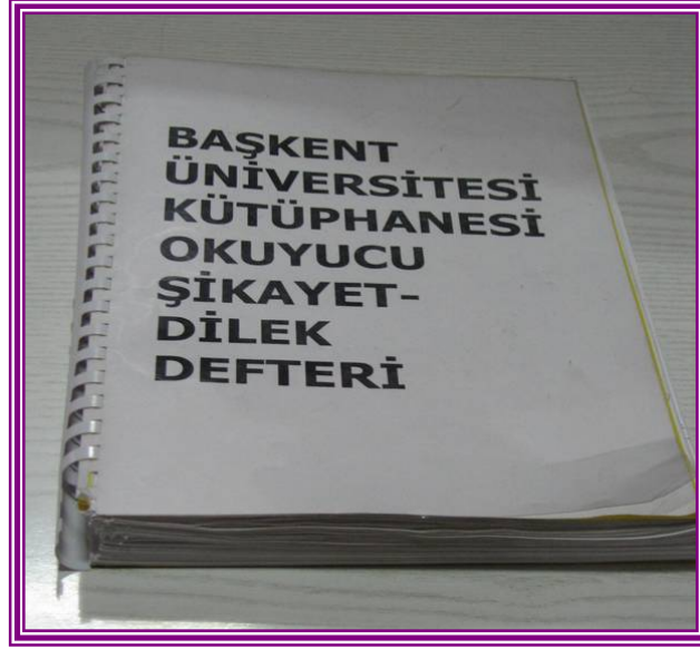
OKUYUCU ŞİKAYET DİLEK DEFTERİ