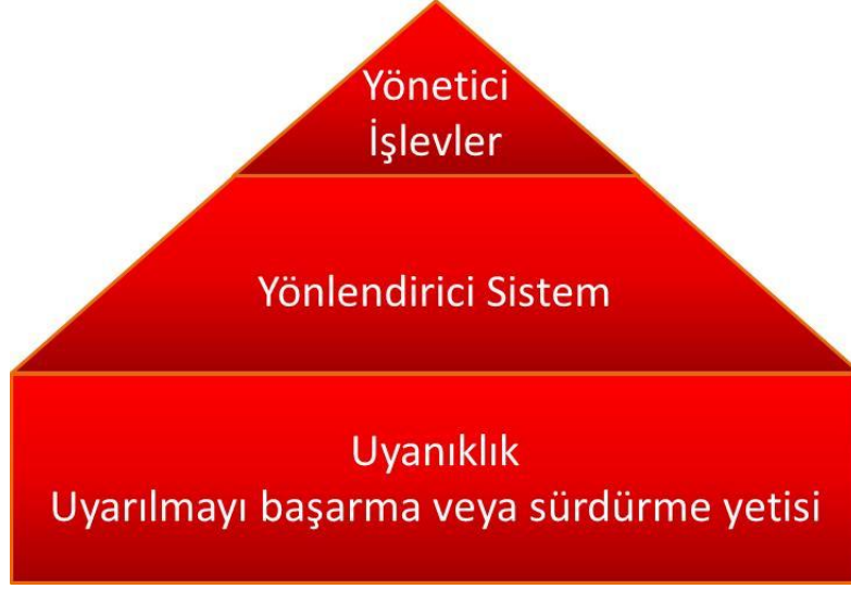
Şekil 2 Dikkat ağlarının işlevsel hiyerarşisi (29)

Dikkat eksikliğini ve klinik durumları anlamak için dikkatin fonksiyonel yapısını anlamak gerekir. Dikkat sisteminin zeminini, uyarılabilirliği başaran ve sürdüren uyanıklık sistemi oluşturur. Uyanıklık, dikkatin bütün boyutlarını içeren bir temeldir. Bu basit ağın fonksiyon görmesi bir üst basamaktaki yönlendirici sistem için bir önkoşuldur (Şekil 2). Yönlendirici sistem duyuşsal bilginin seçimini içerir. En üst basamakta ise üst bilişsel fonksiyonlar olarak da geçen yönetici işlevler vardır. Geniş bir sorumluluk alanı olan yönetici işlevler; görev deęişimi, inhibitör kontrol, çatışma çözümlemesi, hata tespiti ve planlama görevlerini üstlenir. Yönetici işlevler ağı tam olarak anlaşılmasa da anterior singulat kortex orbitofrontal korteks, dorsolateral prefrontal korteks, bazal gangliyonlar ve talamusun ağı dâhil olduđu bilinmektedir. Yapılan çalışmalarda (30) bilişsel işlevleri bozulmuş hepatik ensafalopatili hastalarda serebral glukoz kullanımını ölçen pozitron emisyon tomografisi (FDG-PET) sonuçlarına göre, yine bu alanlarda (anterior singulate girus, dorsolateral prefrontal korteks, temporoparyetal bileşke) glukoz kullanımının azaldığı saptanmıştır.