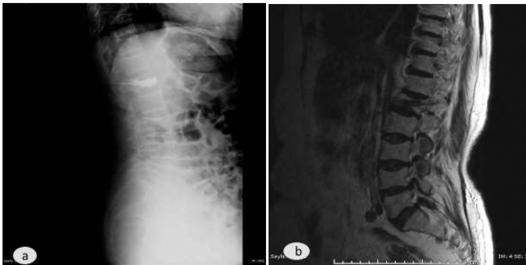
Resim 2 a,b: Kanül trasesine kemik çimento kaçacağı a: X-ray görüntüsü b: MRI sagittal t2 ağırlıklı kesit

torakal bölgede, 19 vertebrada lomber bölgedeydi. 12'sinde korpus dışına kaçak izlenmezken (%46.1), 5 vertebrada kanül trasesine kaçak (%19.2), 3 vertebrada disk mesafesine kaçak (%11.5), 2'şer vertebrada venöz pleksus ve paravertebral dokulara kaçak (%7.6), 1'er vertebrada ise foraminal ve spinal kanala kaçak (3.8%) izlendi (Tablo1,2) .