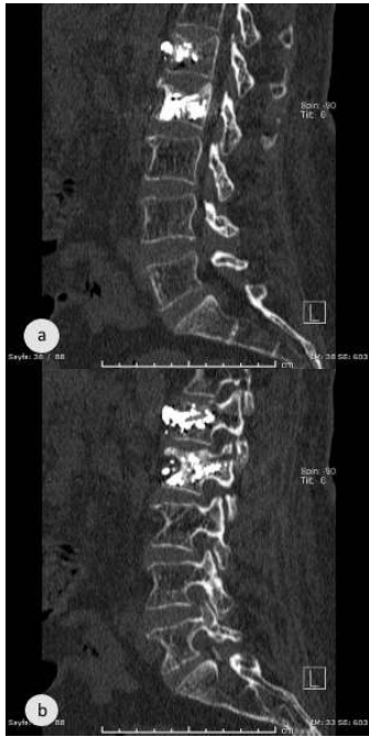
Resim 3 a,b: Paravertebral bölgeye kaçığın görüldüğü sagittal tomografi kesitleri