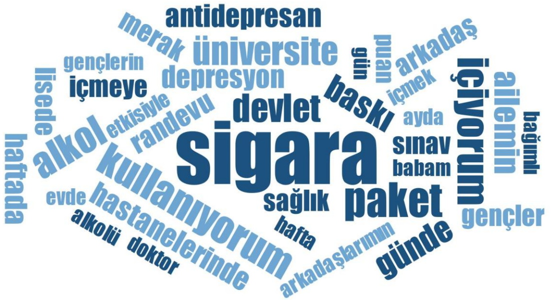
Şekil 8. Gençlerin Sağlık Sistemine Dair Sorulara Verdikleri Yanıtlara İlişkin Kelime Bulutu

Gençlerin sağlık sistemine dair sorulara verdiği yanıtlardan oluşturulan kelime bulutu aşağıda verilmiştir. Kelime bulutu incelendiğinde, “sigara”, “içiyorum”, “baskı”, “antidepresan”, “devlet”, “alkol” gibi kelimelerin ön plana çıktığı görülmektedir.