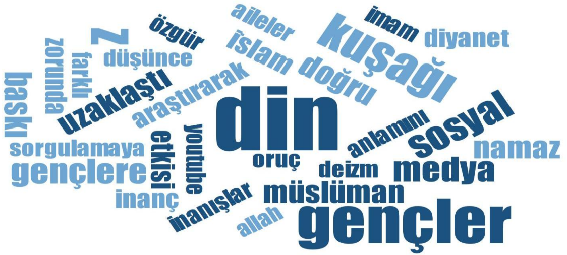
Şekil 10. Gençlerin İnanç Sistemine Dair Sorulara Verdikleri Yanıtlara İlişkin Kelime Bulutu

İnanç Özgürlüğü: “İsteyen Çarşaf Giysin İsteyen Mini Etek Giysin.”