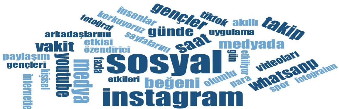
Şekil 6. Gençlerin Teknoloji Sistemine Dair Verdikleri Yanıtlara İlişkin Kelime Bulutu

Araştırmaya katılan Z kuşağı gençlerin, teknoloji sistemi ile ilgili sorulara verdiği yanıtlara ilişkin hazırlanan kelime bulutu aşağıda gösterilmiştir. Kelime bulutu incelendiğinde, “sosyal”, “Instagram”, “Youtube”, “Tiktok”, “gençler”, “Whatsapp”, “medya” gibi kelimelerin ön plana çıktığı görülmektedir.